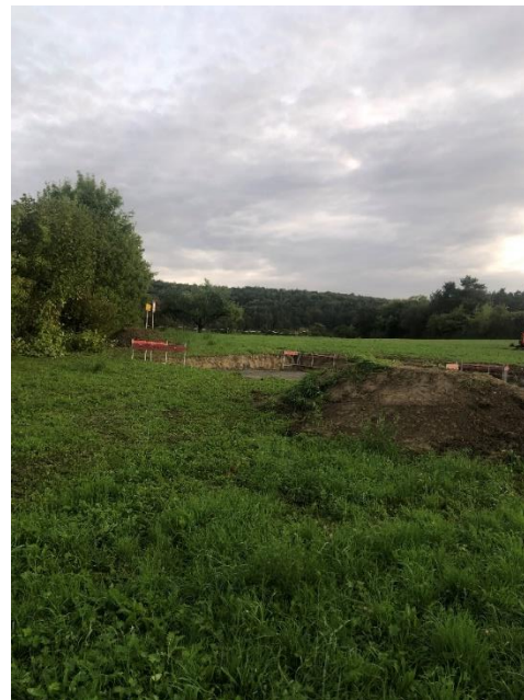
Eindrücke der Baumaßnahme im LSG ‚Hörnle / Geißberg‘, Gemeinde Simmozheim, Kreis Calw vom 20.09.2022